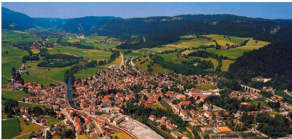
Couvet, früher die zweitgrösste Gemeinde im Val-de-Travers

Wenn sie von der Fusion sprechen, stehen die sachlichen Argumente im