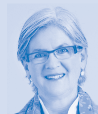
Yvonne Schärli-Gerig Regierungsrätin

Der VLG will bei der Umsetzung eine wichtige Rolle übernehmen. Das neue Gesetz ist die Grundlage für gute, effiziente und wirtschaftliche Lösungen. Die Gemeinden ihrerseits werden alles daran setzen, das Gesetz pragmatisch und praxisnah umzusetzen. Selbstverständlich lassen wir die Gemeinden dabei nicht im Stich. Zum einen delegiert der Bund die Aufsicht an die Kantone. Zum